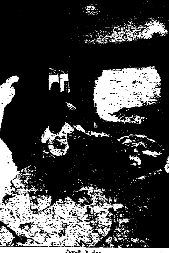
دمار في الحث